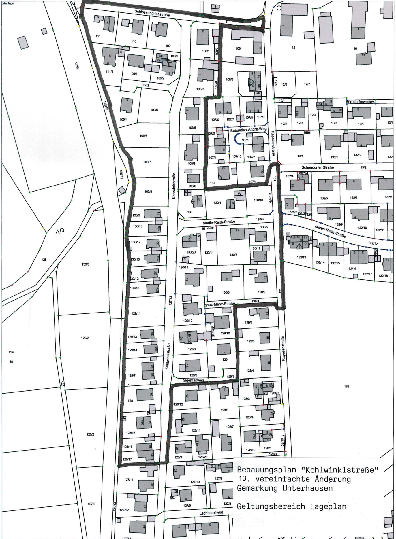
Bebauungsplan "Kohlwinklstraße" 13. vereinfachte Änderung Gemarkung Unterhausen Geltungsbereich Lageplan