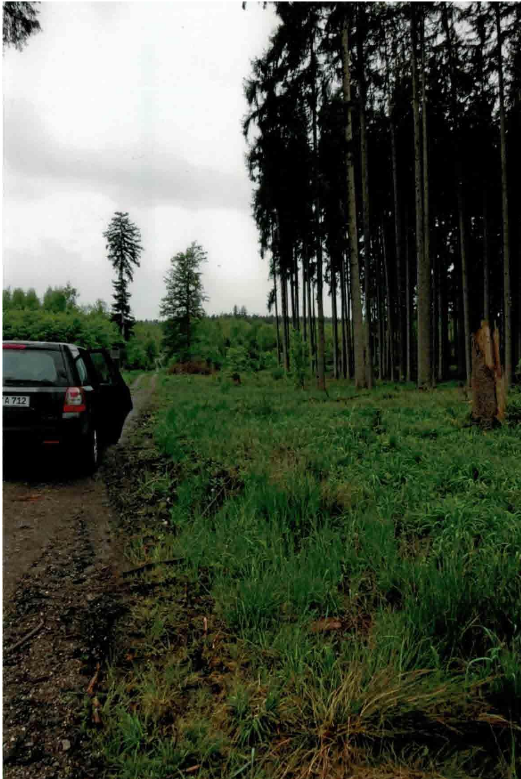
Abb. 1 Hechenberg Distr. I Abt. 2 Best. b0: Sturmwurffläche, Standort für wegbegleitenden Waldinnenrand