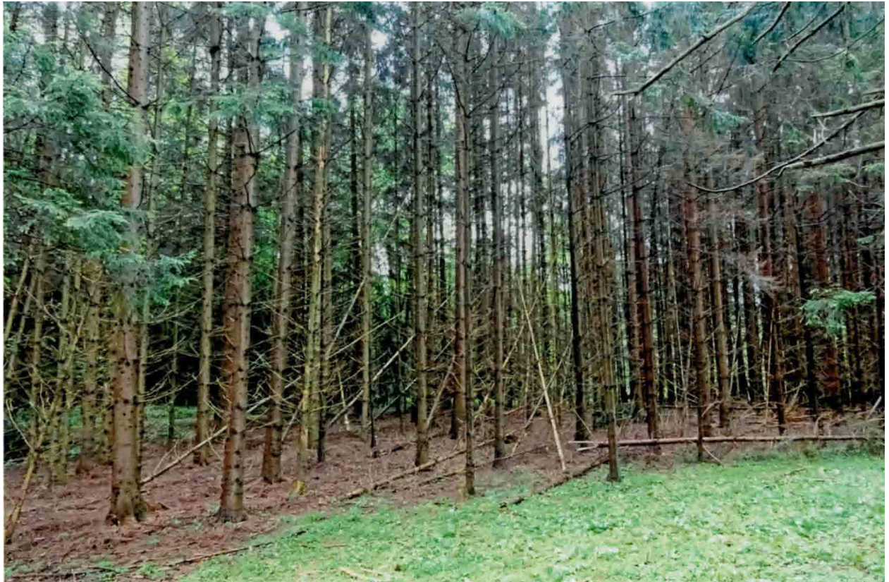
Abb. 3 strukturarmer Fichtenumbaubestand (östliche Teilfläche)