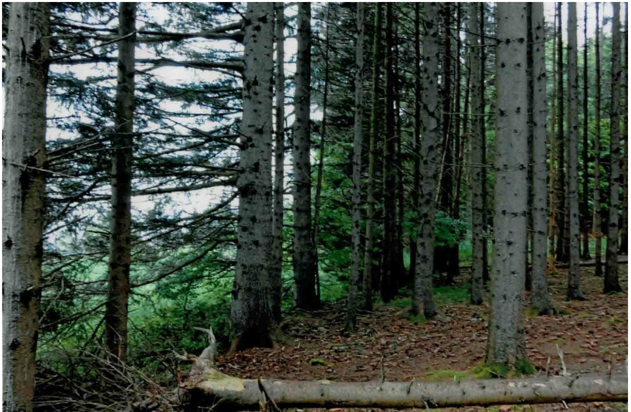
Abb. 1 westlicher Waldrand