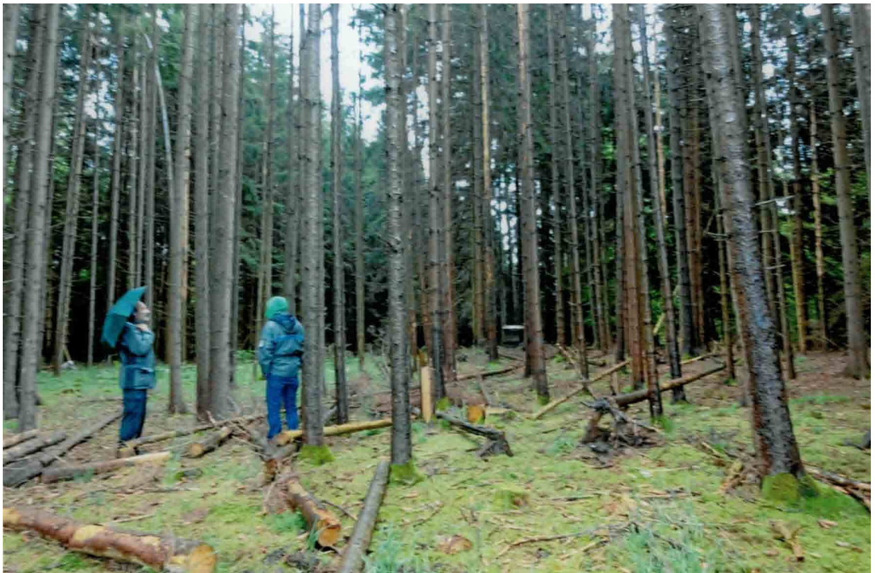
Abb. 2 durch Sturm und Käfer geschädigter strukturarmer Fichtenbestand