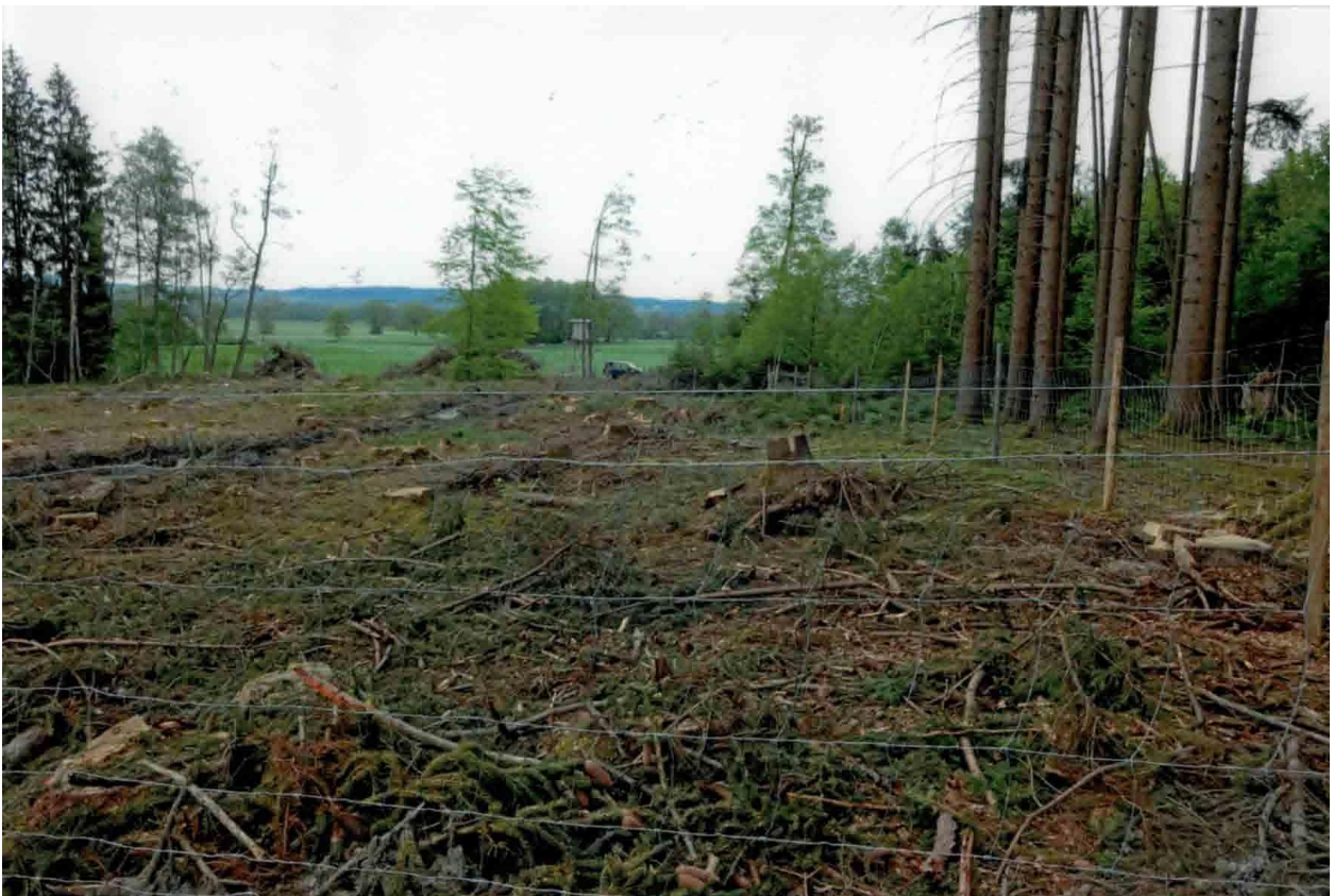
Abb. 1 Bräuraut: Kahlfäche nach Sturm, gezäunt; Pflanzung von Ei, in Bachnähe (Abb. oben) von Schwarzerle