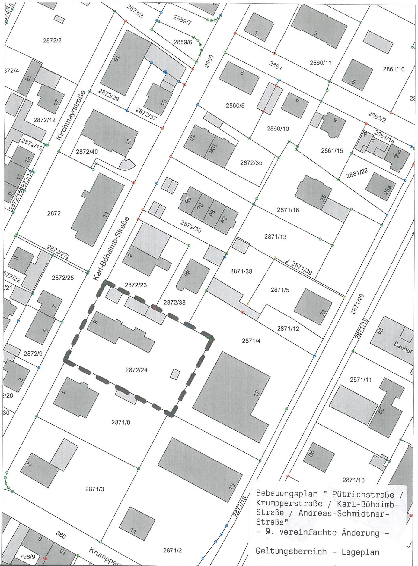
Bebauungsplan " Pütrichstraße / Krumpperstraße / Karl-Böhaimb- Straße / Andreas-Schmidtners- Straße" - 9. vereinfachte Änderung - Geltungsbereich - Lageplan