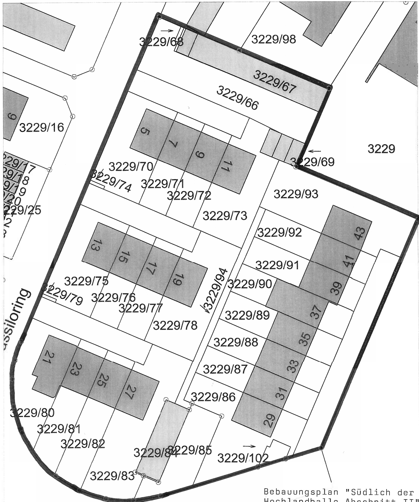
Bebauungsplan "Südlich der Hochlandhalle Abschnitt II" 3, vereinfachte Änderung