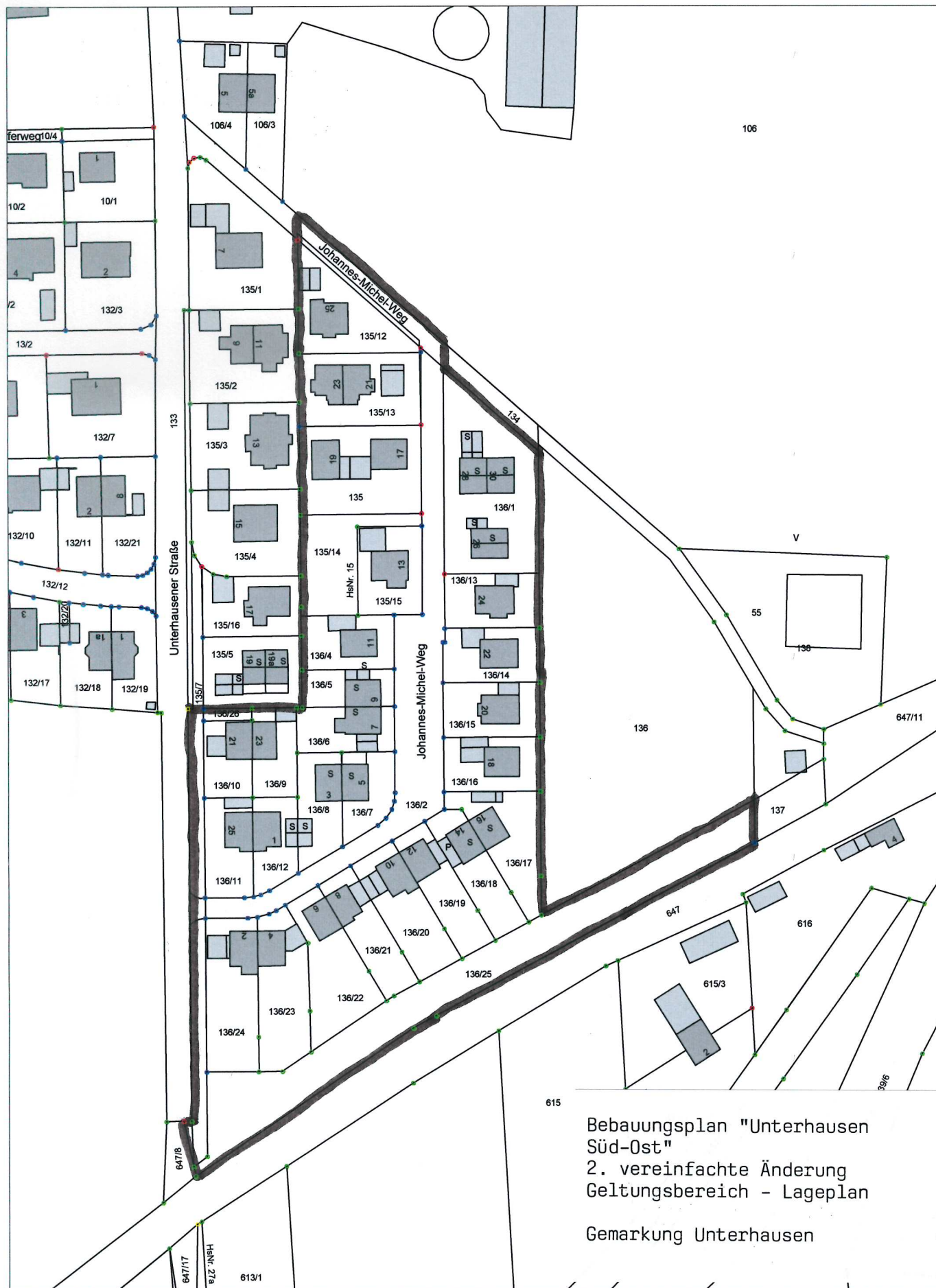
Bebauungsplan "Unterhausen Süd-Ost" 2. vereinfachte Änderung Geltungsbereich - Lageplan Gemarkung Unterhausen