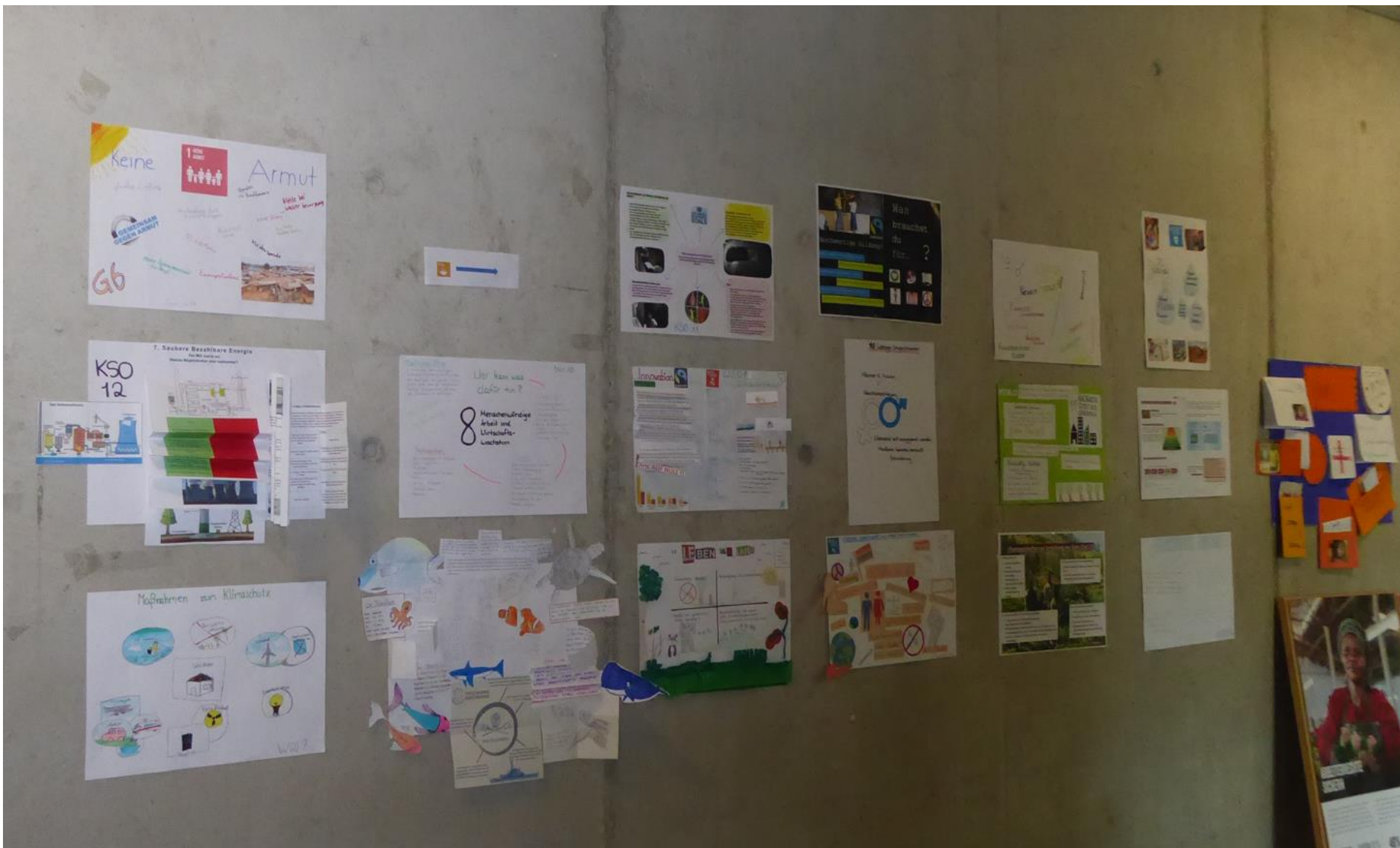
Die Projektwand im Foyer der Oberlandsschule Weilheim